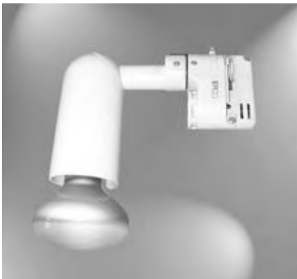
B. 10 b Strahler (60 W), einschl. Adapter für Stromschiene, weiß / Lamps (60 W) incl. adapter for busbar, white 13,55 € / Stück / Unit