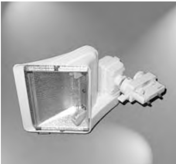
B. 11 b Halogenstrahler (300 W), einschl. Adapter für Stromschiene, weiß / Halogen lamp (300 W) incl. adapter for busbar, white 35,30 € / Stück / Unit