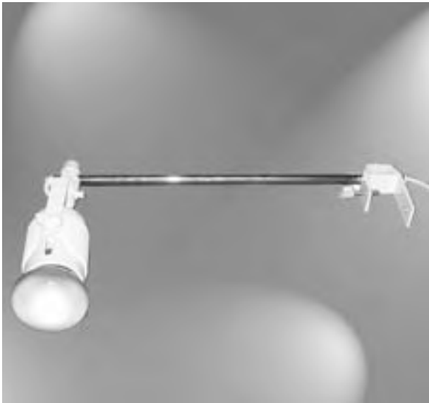
B. 10 a Strahler (60 W), weiß (wahlweise auch als Halogenstrahler silber erhältlich), verchromt mit Ausleger. Bitte Ausführung bei der Bestellung angeben. / Lamps (60 W), white (alternatively available as halogen lamp, silver) chrome-plated with arm. Please indicate model with your order. 13,55 € / Stück / Unit