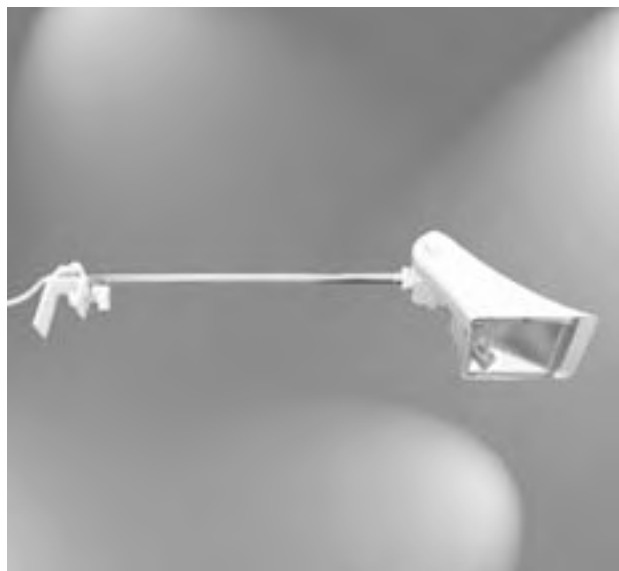
B. 11 a Halogenstrahler (300 W), verchromt mit Ausleger, weiß / Halogen lamps (300 W), chrome-plated with arm, white 35,30 € / Stück / Unit